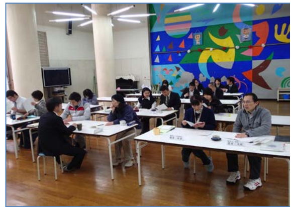
小中教員による学園全体会