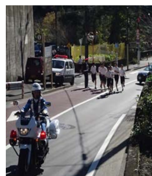
同日マラソン大会