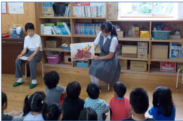
中学生による小学生への読み聞かせ

小学校と中学校の教員が授業方法について協議したり、子供の情報共有を行ったりすることで檜原の子供たちの学力向上、健全育成、心の育成を進めてきました。